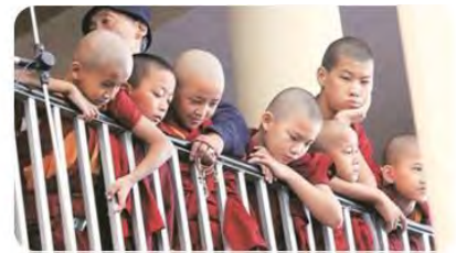
Tibetan Refugee Children