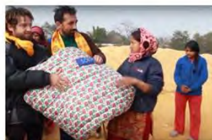
Construction of 2 houses after the earthquake in Nepal