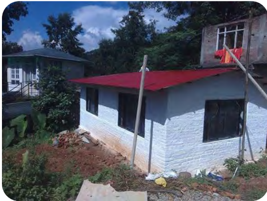
House for a family of 5 people

Construction of two houses after the earthquake in Nepal and aid to the population