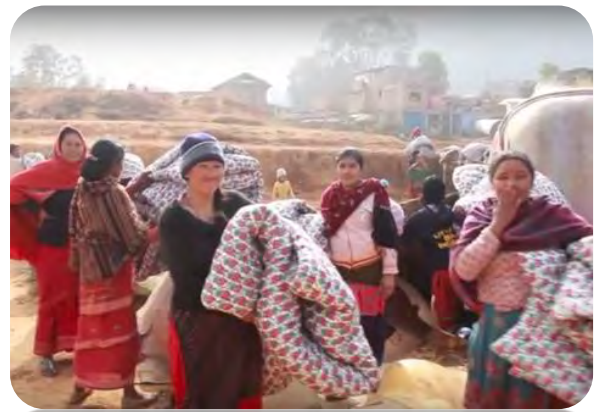
Donation of Blankets to all the village

Vaccination of 800 children and adolescents to stop an epidemic of Hepatitis B in the Tibetan refugee camps in India