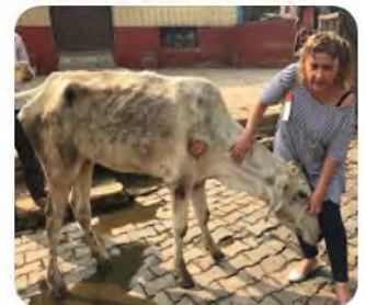
Animals India, Latam