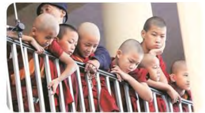
Tibetan Refugee Children