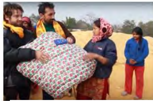
Construction of 2 houses after the earthquake in Nepal