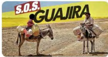
Guajira children Colombia