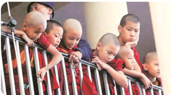
Children of the Tibetan refugee

Vaccination of 800 children and adolescents to stop an epidemic of Hepatitis B in the Tibetan refugee camps in India