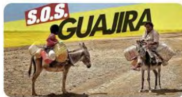
Guajira children Colombia